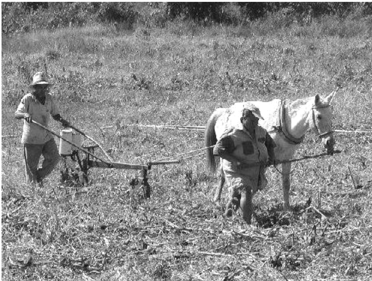
Petits producteurs au Brésil.