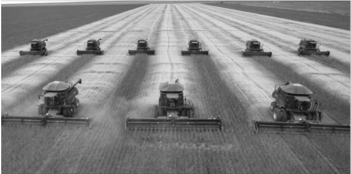
Récolte de soja dans le Mato Grosso en mars 2012.