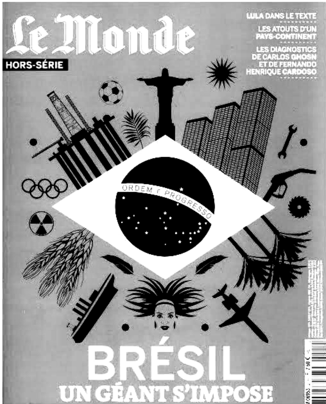
Le Monde , hors-série, septembre 2010 Illustrateur : Séverin Millet