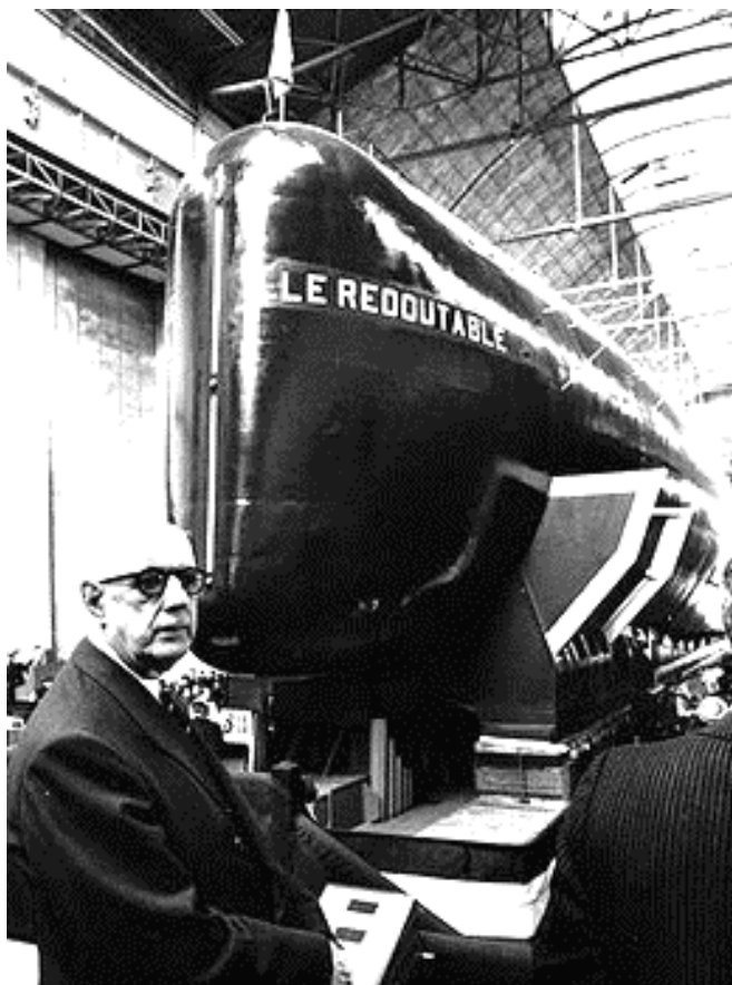
Le lancement du Redoutable, sous-marin nucléaire lanceur d'engins, le 29 mars 1967 à Cherbourg